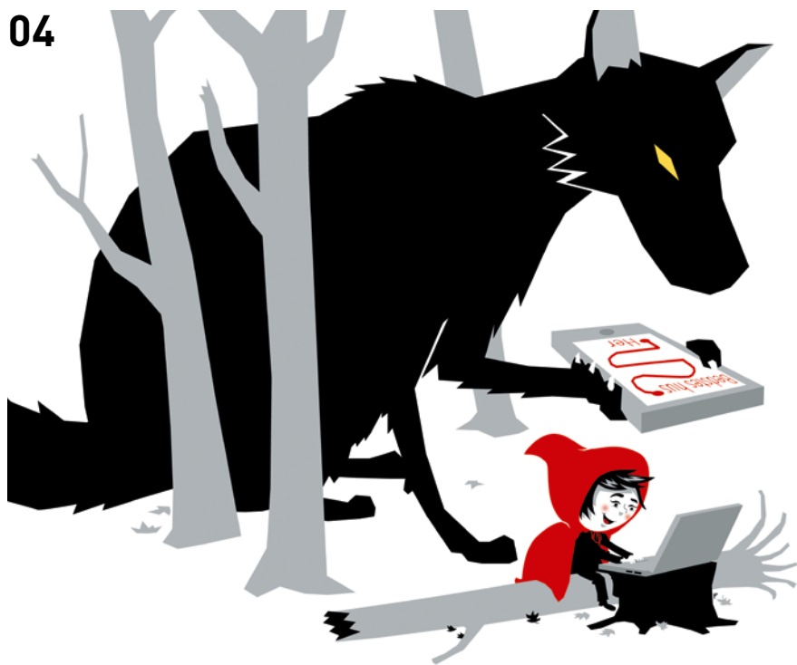
ILLUSTRATION: PETER HERMANN