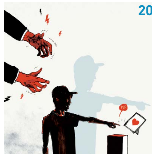
ILLUSTRATION: RASMUS MEISLER / SPILDAFTID