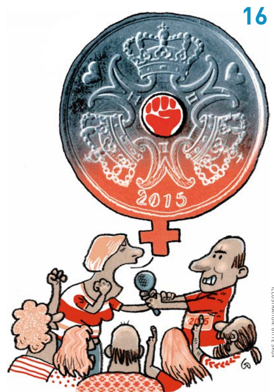
ILLUSTRATION: OTTE SKOV